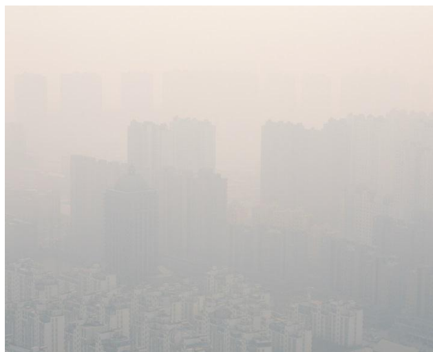
Бенедикт Партенхаймер, Shijiazhuang, AQI 360 , 2014 г.

Победители конкурса Syngenta Photography Award 2015 были оглашены сегодня вечером на церемонии награждения в Сомерсет-хаусе, Лондон.